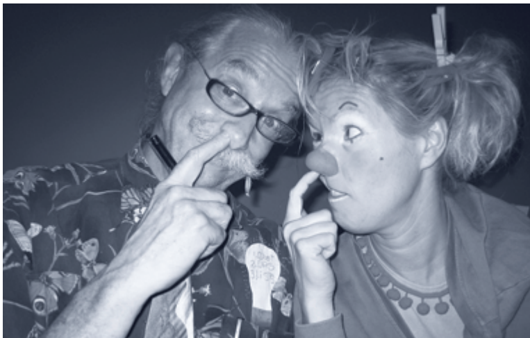
På en workshop mødte jeg manden, der startede det hele i USA: Patch Adams, den første hospitalsklovner.

med børn også at beskæftige mig med demente ældre. På de somatiske afdelinger har jeg passet mange demente gennem årene og holder af at møde dem i deres individuelle univers.